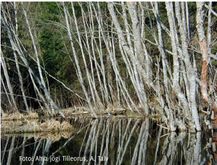
Foto: Ahja jõgi Tilleorus