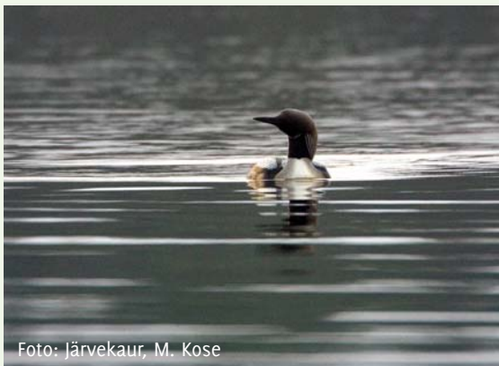
Foto: Järkeaur

PULLIJÄRVE HOIUALA (62,8 ha) paikneb Kagu-Eestis Võrumaal Misso vallas. Hoiuala, mis hõlmab ainult Pullijärve on loodud 2005. aastal, eesmärgiga kaitsta Pullijärve kui üleeuroopaliselt tähtsat elupaigatüüpi (liivalade vähetoimeline järv) ning kaitsealuse hariliku vingerja ( Misgurnus fossilis ) elupaika. Hoiuala kuulub Euroopa kaitstavate alade võrgustikku Natura 2000.