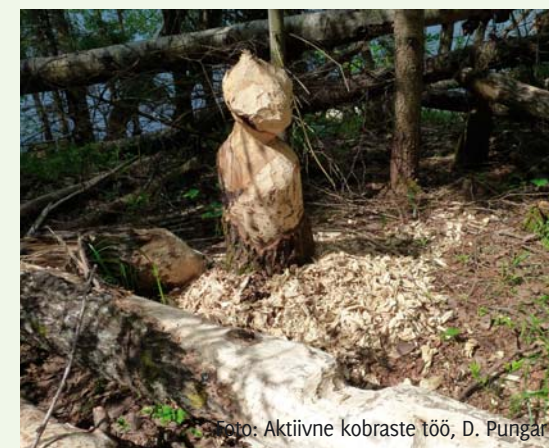
Aktiivne kobraste töö

Pullijärve idakaldal oleva sauna juures on filmitud 1982. aastal mõned Eesti filmiklassika hulka kuuluva filmi „Nipernaadi“ stseenid. Praegu on hoone kehvast seisukorras.