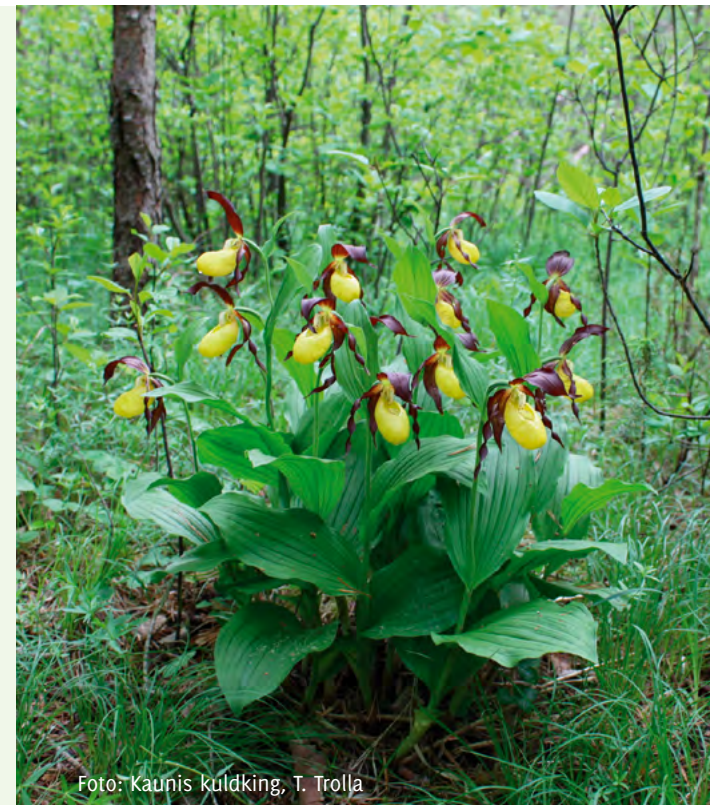
Foto: Kaunis kuldking

vanu elurikkaid metsi. Viljaka mullaga oosidel on valdavad salumetsad , peamiselt sinilillekuusikud, kus põõsarindes esinevad sarapuu, kuslapuu, mage sõstar. Kõige õiteküllasem aeg on kevadel enne puude lehtimist, mil metsaalune ei ole veel liiga hämar.